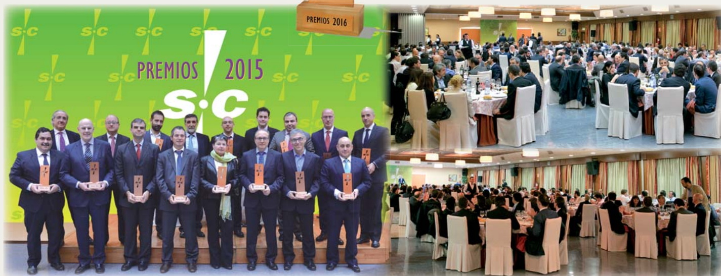
Los galardonados de la duodécima edición de los Premios SIC.

La pretensión de estos galardones no es otra que la de hacer público reconocimiento del buen hacer de significativos protagonistas de un sector —el de la ciberseguridad, la seguridad de la información y la privacidad en nuestro país— cuyo estado de madurez y proyección ha alcanzado un punto crítico.